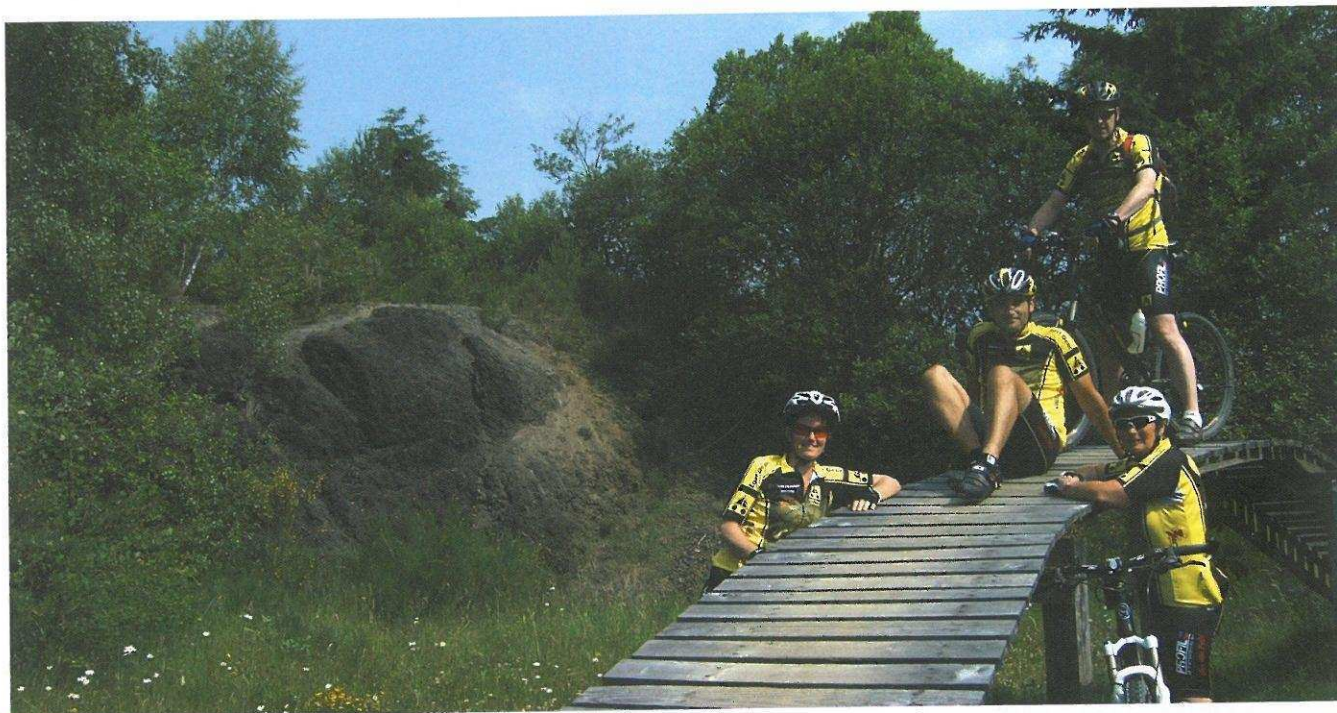
'NORTH SHORE' DREAMS

september waarvoor wij meestal naar het buitenland trekken. Naast de offroad-ritten zijn er ook mogelijkheden voor leden die het fijn vinden om wat snelheid te maken met de racefiets. Daarvoor mogen zij aansluiten bij de trainingen op de weg van onze collega-vereniging De Veluwerijders in Dieren. Op hun beurt mogen de Veluwerijders meerijden met onze mountainbikeritten. Een bijzondere samenwerking! Tevens heeft Last Gear een populaire Ladies Only-mountainbikegroep, die op dit moment rond de 25 dames telt. Ook organiseren wij als club zelf een toertocht, die meestal in maart gehouden wordt, een avondvierdaagse en eens in de twee jaar een spannende Halloween-nachttocht."